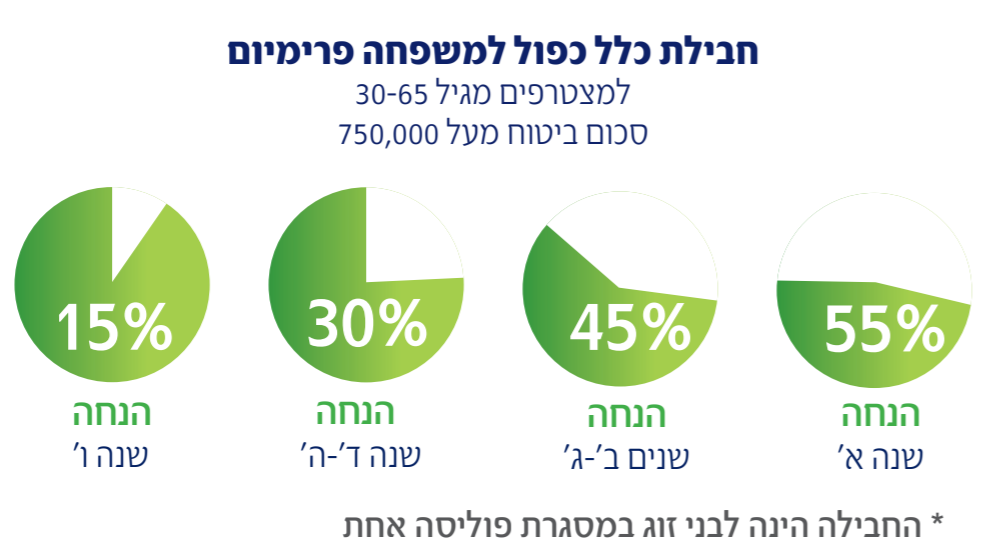
* החבילה הינה לבני זוג במסגרת פוליסה אחת