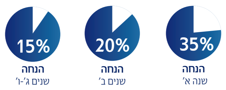
שוהם למשכנתא סכום ביטוח מעל 500,000 ₪ למצטרפים בכל גיל