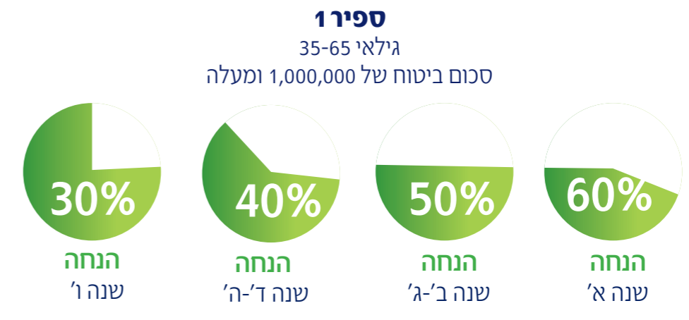
*במסלול זה לא ניתן להוסיף הנחות ארוג דייגטלי