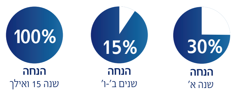
שוהם למשכנתא סכום ביטוח מעל 750,000 ₪ למצטרפים עד גיל 56 בהפחתת 5% נפרעים