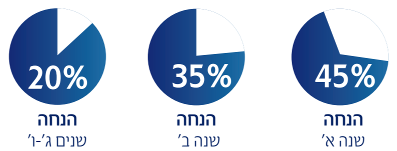
שוהם למשכנתא למצטרפים עד גיל 56 סכום ביטוח מעל 750,000 ₪