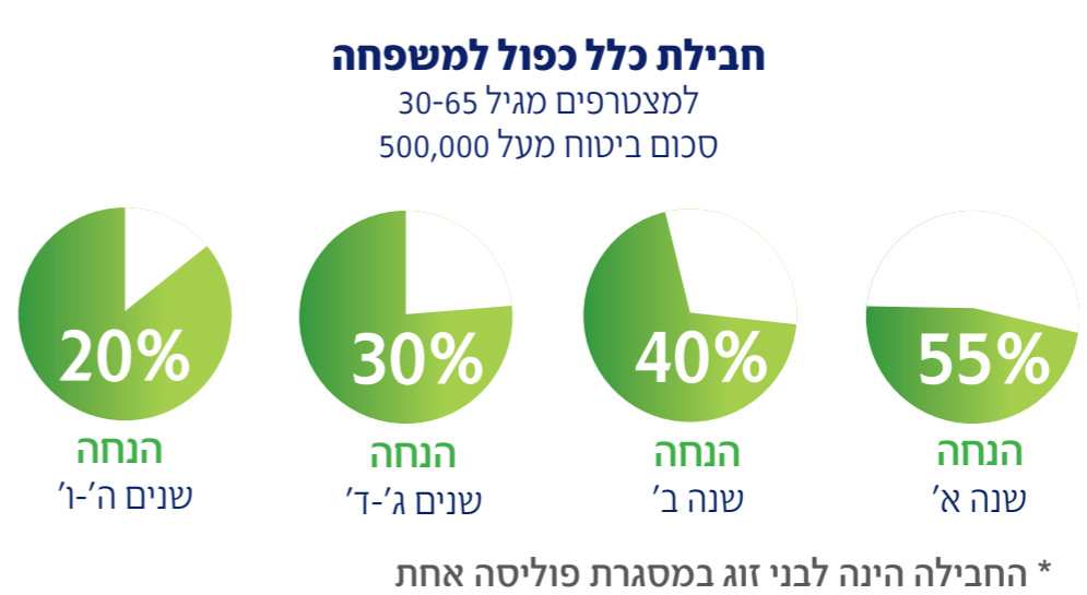
* החבילה הינה לבני זוג במסגרת פוליסה אחת